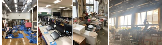
充実した美術科の実習施設