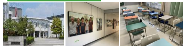
校門からの風景 ギャラリースペース カラフルな机や椅子（個性の象徴）