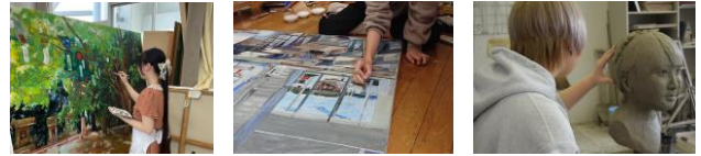
洋画 日本画 彫刻