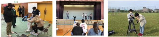
体験（介護ロボット体験） 表現活動 観察