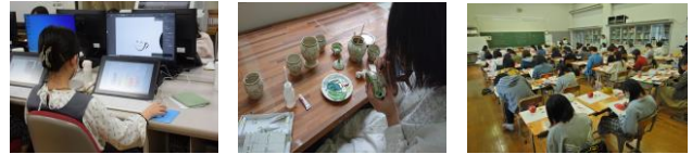
ビジュアルデザイン クラフトデザイン 構成