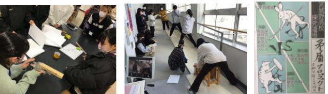
課題解決型ワークショップ「探究道場」の開催（中学生対象）