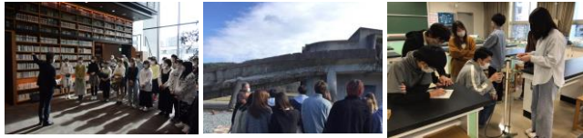
文献調査（図書館訪問） フィールドワーク 実験