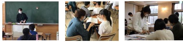
教育補助派遣プログラム（田子小学校） 学習支援ボランティア（田子中学校） こども探偵事務所（杉村博美術館）