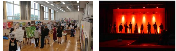
自発的に集まった生徒ボランティアによって運営されます。