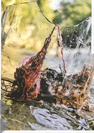
第19回 中学校部門 金賞【ハグロトンボとゴミ】