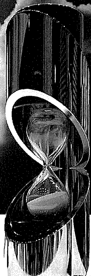
優勝トロフィー 「時の砂時計」